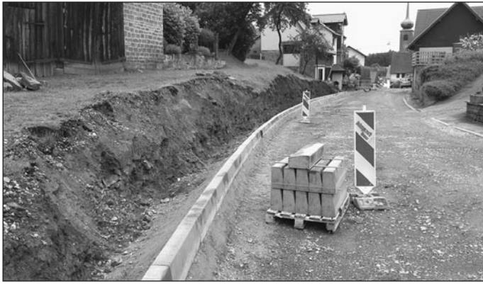
Sobald die Einbindung der Stromanschlüsse erfolgt ist, wird der weitere Straßenausbau in Angriff genommen.