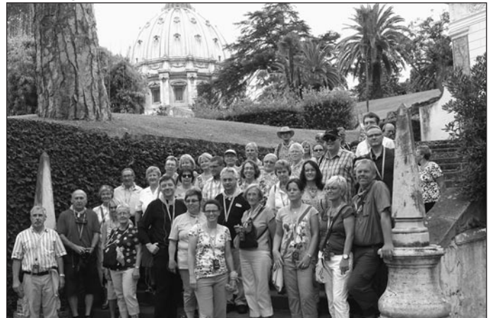
Die Pilgergruppe in den Vatikanischen Gärten