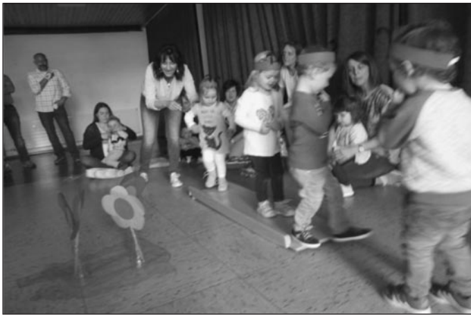
Die Kinder beim Spiel für die Eltern